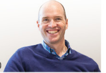
本·霍洛维茨 (Ben Horowitz)